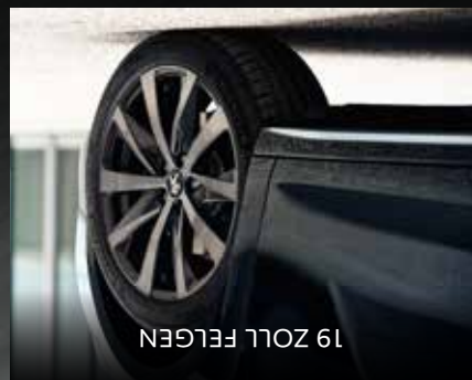
19 ZOLL FELGEN

Die schicken, zweifarbigen 19 Zoll „Augusta“ Diamant-Leichtmetallfelgen unterstreichen den sportlichen Auftritt des Peugeot 508 SW.