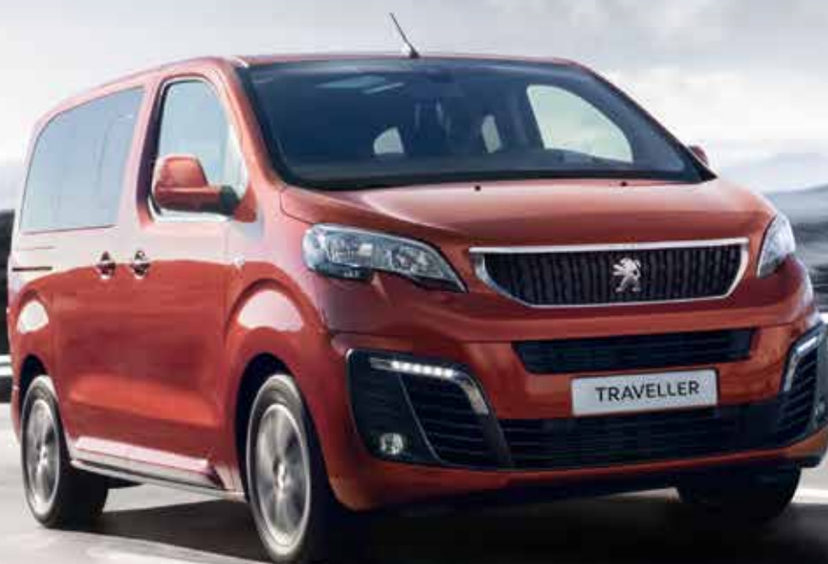
BIS ZU 8 SITZE