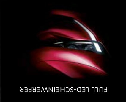
FULL LED-SCH EINWERFER

Die neue Lichtsignatur an der Frontpartie mit Full LED-Scheinwerfern und LED-Tagfahrlichtern verleiht dem Peugeot 508 einen ausdrucksstarken und exklusiven Auftritt.